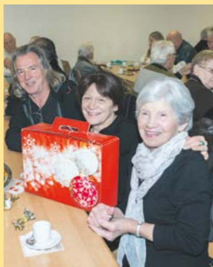
Les affaires sociales