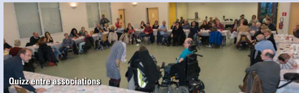
Quizz entre associations