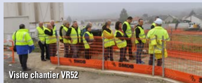
Visite chantier VR52