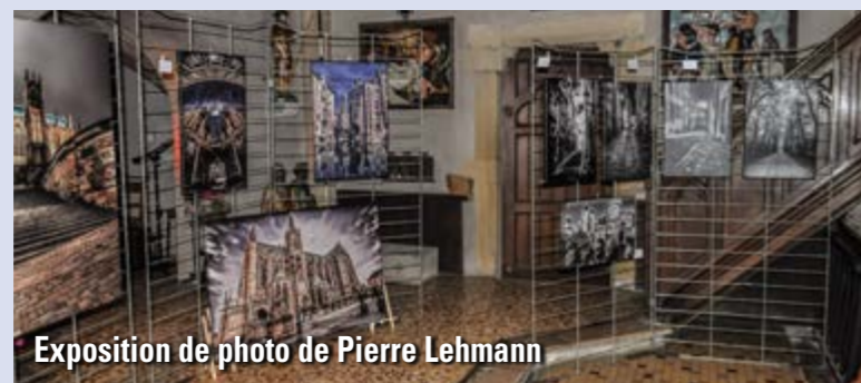
Exposition de photo de Pierre Lehmann