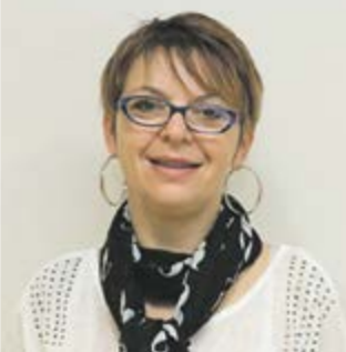
L'action culturelle et la démocratie participative