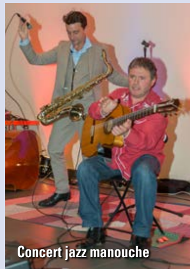
Concert jazz manouche