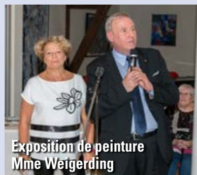
Exposition de peinture Mme Weigerding