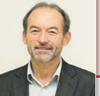
Les fêtes et cérémonies ainsi que le tourisme